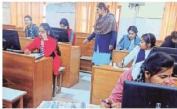
प्रतियोगिता में भाग लेती छात्राएं।