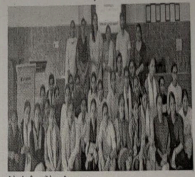
विदेह टीम की छात्राओं के साथ शिक्षक।